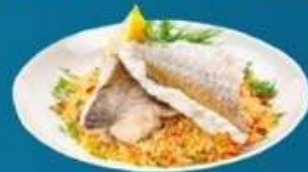
Пеленгас запеченный под овощами с булгуром