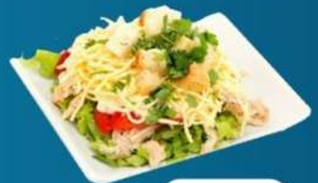
Цезарь с курицей