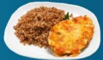
Отбивная свиная с гречкой