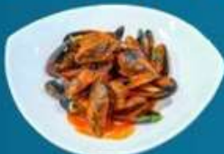
Мидии черноморские в томатном соусе