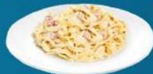
Паста с курицей в сливочном соусе