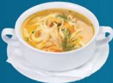
Лапша с курицей