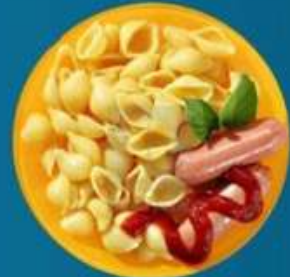
Сосиски с макаронами