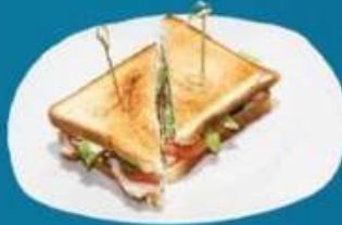
Сэндвич с ветчиной и сыром