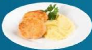
Котлета куриная с картофельным пюре