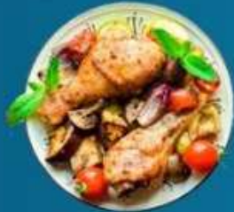
Бедро куриное с овощами гриль