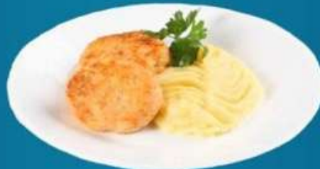
Пюре с куриной котлетой